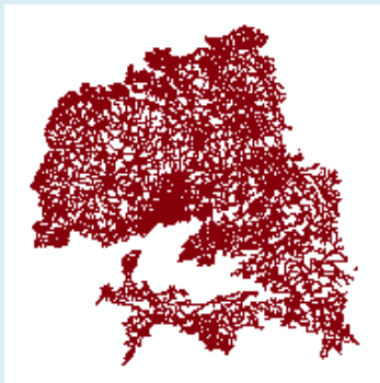
Champ / Légende